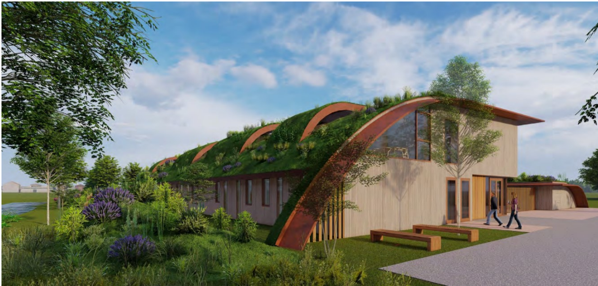
Impressie op basis van Programma van Eisen nieuwbouw Domus Plus, aanzicht langsegevel (noordzijde) en kopgevel (westzijde)

Voor de nieuwbouw van Domus Plus is een programma van eisen (PvE) opgesteld dat ter informatie is bijgevoegd als bijlage 7. In het PvE staan de technische en functionele eisen en wensen die de gemeente aan de nieuwbouw en de bijbehorende buitenruimte stelt. Het programma van eisen is afgestemd met de toekomstige exploitant die ook betrokken wordt bij het ontwerp. Met de decemberrapportage heeft de gemeenteraad een krediet vrijgegeven voor het maken van een ontwerp en overige voorbereidende werkzaamheden voor de nieuwbouw. Als het bestemmingsplan is vastgesteld kan het ontwerp verder worden uitgewerkt en de bouw worden voorbereid. Bij de gemeenteraad wordt daarvoor een krediet voor realisatie aangevraagd.